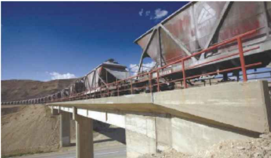
רכבת ישראל החליטה על העלאת תעריפי המטענים ב-13%

*צריכה ממוצעת = 8,000 קוט"ש לשנה; צריכה נמוכה = 6,000 קוט"ש לשנה