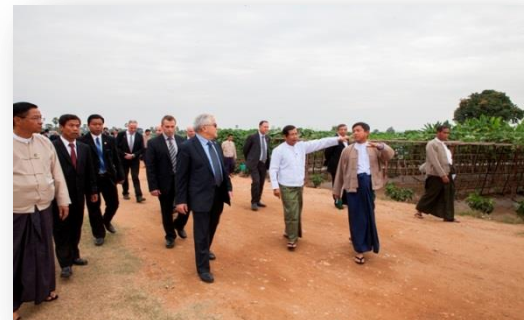
השר שמיר ופמלייתו בביקור רשמי בחוות הדגמה חקלאית בבירה ניפידאו

חשיבות הביקור נעוצה בחשיפה שהתקבלה ליכולות הישראליות הן מול הסקטור הממשלתי והן מול הפרטי, בחיזוק הקשר לממסד החקלאי, ביצירת והידוק קשרי עבודה בין חברות מישראל וממיאנמר ובעובדה שמזה 35 שנה לא התקיים ביקור בדרג של שר מישראל.