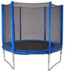
טרמפולינה בינונית/גדולה (תלוי במידות)