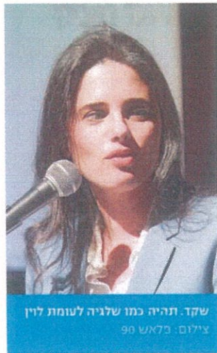
שקד. תהיה כמו שליגה לעומת לוי