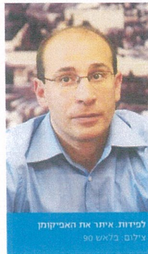
למידות. איתור את האביקוון

ניהול הכלכלה לטענת כולנו. אם הליכוד רוצה לחזור להשקפת עולמו, ונתניהו מצהיר על כלכלה חופשית והורדת רגולציה, אסור להעביר לידי מפלגת כולנו את תיקי האוצר והכלכלה, שהם תיקים מרכזיים. אסור להעביר את ליבת ענייני כלכלת המדינה למפלגה קטנה. מתוך רצונו להוריד את יוקר המחיה ולהגן על הצרכן רדף השר כהן את המגזר העסקי ואיבר את האיוון. הוא התמקד ביבואנים הישיבים וכינה אותם 'יבואנים בלעדיים', אף שהם פועלים בתנאי תחרות חריפה. הוא הכשיר את הקרקע לרדוף את היבואנים בהצעת חוק של ההגבלים העסקיים. אין דבר כזה בשום מקום בעולם.