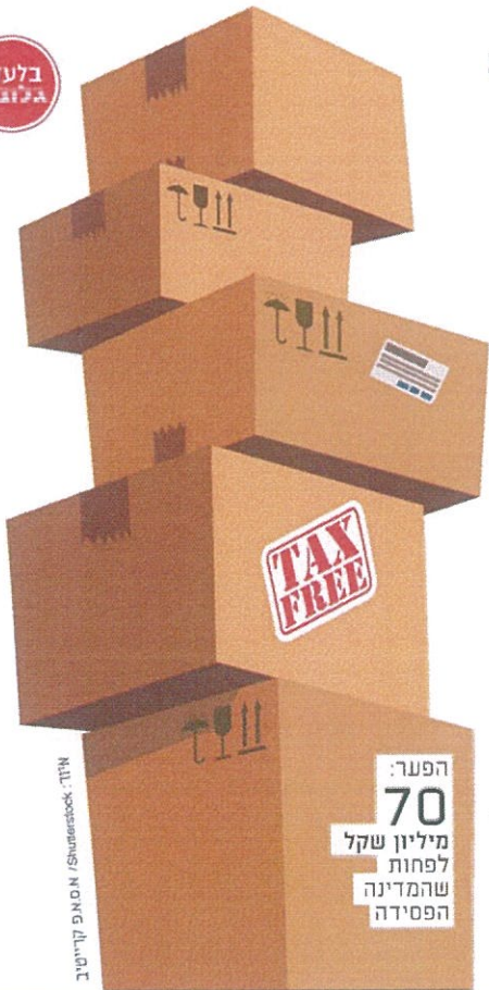
הפער: 70 מיליון שקל לפחות שהמדינה הפסידה