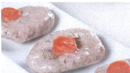
תכינו מקום לגפילטע: כמה דגים יאכלו הישראלים בחגים?

החגים מגיעים ואיתם הקניות: באיגוד לשכות המסחר צופים גידול של כ-6% במכירות רשתות השיווק השונות בתחומי המזון, כלי בית, ההלבשה ומוצרים בני קיימא, בחודש ספטמבר הקרוב. מבדיקה שערך אגף הכלכלה באיגוד עולה כי עיקר העלייה צפויה עקב גידול משמעותי בתחום כלי הבית ומטבח.