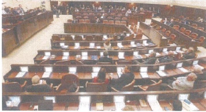
מליאת הכנסת. ראוי שמשרדי המחשלה ישמשו דוגמה