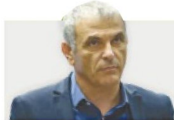
למה שר האוצר כחלון עוצר מהלך שעשוי להביא לירידה של 4% במחירי הדירות?

המיסוי על העסקת עובדים זרים בענף הבנייה הוחל ב-2003 כדי לעודד העסקת עובדים ישראליים בענף הבנייה, בייחוד בעבודות הרטובות כמו ברזי לנות, ריצוף וטיח. בשלהי שנות ה-90 ותחילת שנות ה-2000 הגיע מספרם של העובדים הזרים לשיא של יותר מ-50 אלף עובדים – בעוד כיום, בתקופה שבה הם נדרשים יותר מתמיד, צנח מספרם לכ-10,000 עוב-