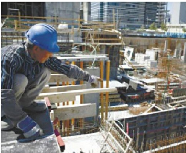
עובד זר בתל אביב. "הישראלים לא מעוניינים בעבודות בתחום הבניין"

הענף ותביא להארכת משך הבנייה וצמצום התחלות הבנייה. ברו"ח הומלץ להשתמש בהי כנסות המדינה מהעסקת עובדים זרים בענף לטובת קרן לעידוד עובדים ישראלים בענף. כך, סברו כותבי ההמלצות, לא ייפגע קצב התחלות הבנייה, ולא יתייקרו עלויות הבנייה.