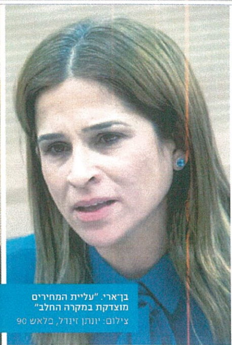
בריארי. "עליית המחירים מוצדקת במקרה החלב"

את תיקון שטייניץ, המגדיל את תשלומי המס של חברות הרהל, הפעילו עלי להציע מפת ועד להורעה הריעה. גבאי מתלונן על קמפיין נגדו, אבל זה כלום לעומת מה שאני ושטיינסקי חוויונו."