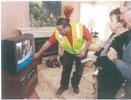
הסוף להמתנה בבית

היו"ר כבל: "שמנו סוף למעצר הבית הבלתי נסבל שבו מוצאים את עצמם צרכנים שבסך-הכל ממתנינים לשירות או המוצר שהזמינו" - ההצעה אושרה על-אף התנגדות רבה מצד נציגי חברות רבות בהן חברות הגז וההובלה