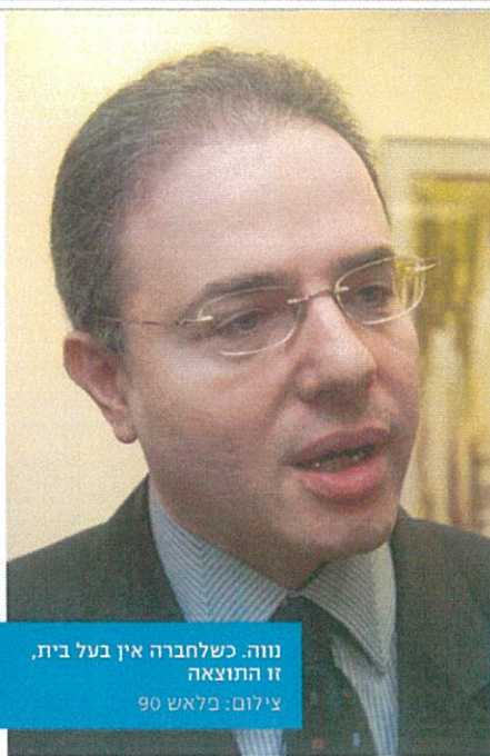
נווה. כשלחברה אין בעל בית, זו התוצאה