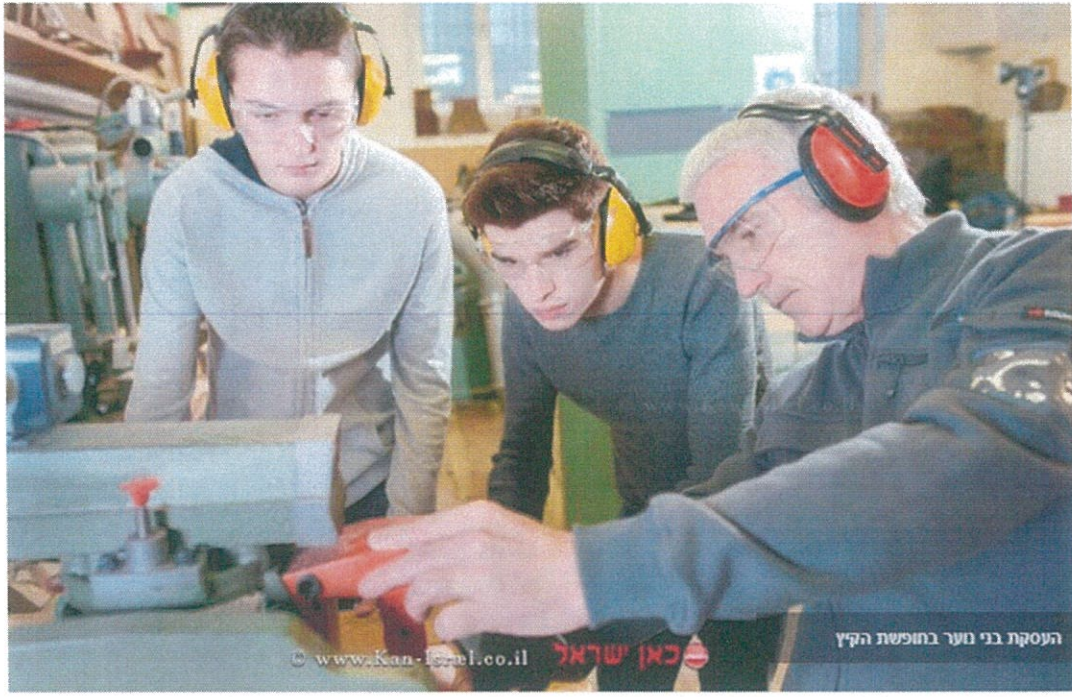
העסקת בני נוער בחופשת הקיץ www.Kan-Israel.co.il | כאן ישראל