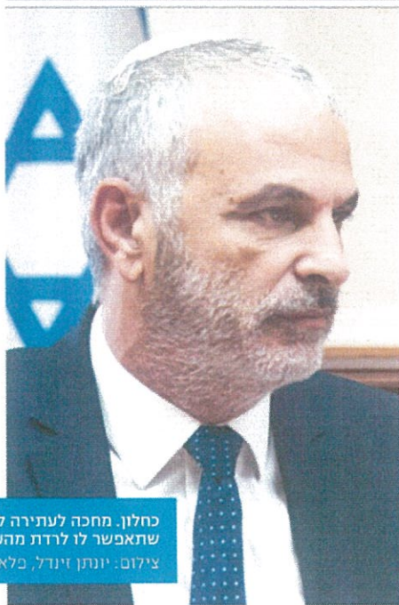
כחלון. מחכה לעתירה לבג"ץ שתאפשר לו לרדת מהעץ