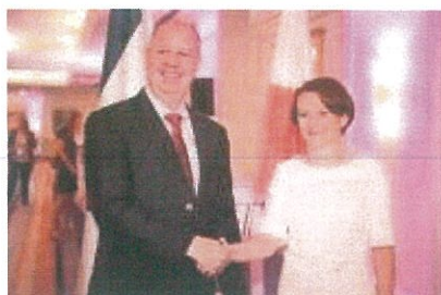
צ'דוויגה אמילביץ' שרת היזמות והטכנולוגיה של פולין וצחי הנגבי, השר לשיתוף פעולה אזורי.

השרה צ'דוויגה אמילביץ' דיברה על יחסי הסחר וההזדמנויות העסקיות לשיתופי פעולה וחתמה את דבריה: 'עלינו להתגבר על המצב המאתגר בו אנו מצויים ולנצל את ההזדמנות הניתנת לנו היום לפיתוח הקשרים העסקיים'.