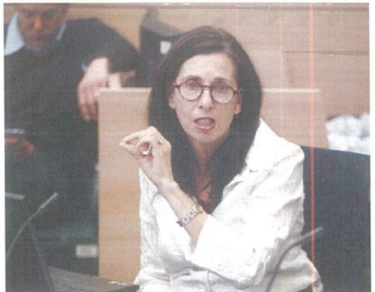
הממונה על רשות שוק הון, דורית סלינגר