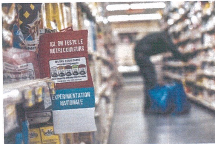
סימון מוצרי מזון בצרפת. מסקנות הוועדה לתזונה בריאה פורסמו בסוף 2016.

שר הבריאות, יעקב ליצמן, הגיע להסכמות עם שרי האוצר והכלכלה משה כהלון ואילי כהן, שלפיהן מוזן מוזק יסומן בסמנים אדום שיפיע בחזית האריזות – כך אמר אתמול מנכ"ל משרד הבריאות, משה בר סימון טוב. עד כה התנגדו משרדי הכלכלה והאוצר לסימון בחזית האריזות, בטענה שהדבר יגדיל את העי ליוות ליבואנים ויצרנים, ולכן יביא לעליית מחירים, ודרשו כי הסימון יופיע מבח האריזות.