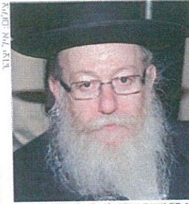
שר הבריאות יעקב ליצמן. לא מוותר

ביום שבו התפרסמו לראשונה התקנות, בנובמבר 2016, החל איגוד לשכות המסחר בהפעלת לחצים אינטנסיביים שניתנה להחליטין את התמינה. האיגוד עירב כל מי שרק אפשר כדי לעצור את מה שהתרחש עד אותו שלב מאחורי גבו: את משרד הכלכלה, משרד המשפטים, משרד האוצר, הממונה על ההגבלים העסקיים, האגוד האירופי ואפילו שגרירות ארה"ב - כל הגורמים הללו הביעו עמדה המתנגדת לתקנות בדרך זו או אחרת.