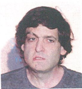
פרופ' דן אריאלי. החלטה בשלושה חלקים

צריכת מזון בריא וצמצום צריכת מזון מזיק, בדגש על סוכר, נהרן ושימון רווי. מנסקות הועדה פורסמו בנובמבר 2016, ובאפריל האחרון פרסם המשרד טיוטה ראשונה לציבור עם המלצותיו לסימון מוצרי מזון. בחודש יוני קיימה ועדת הבריאות של הכנסת ריון על תוכנית המשרד לסימון מוצרי מזון, ובתקופה הקרובה התקנות חיו אמורות להגיע לאישור הועדה, ולהיכנס לתוקף כבר בינואר 2018.