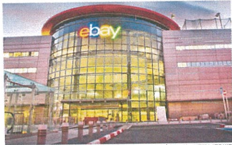
משרדי איביי בישראל. יהנו מהפטור?

סחר זרים נהנה מפטור ממע"מ על מוצרים בייבוא אישי עד סך של 75 דולר, וכן מפטור ממכס על מוצרים בייבוא אישי עד סך של 500 דולר, בעוד שברכישת מוצרים בשוקים הישראליים הוא נדרש לשלם מסים. לדברי עורכי הדין, הפטור מייצר אפליה ו"מעניק לעסקים זרים יתרון שאינו מעניק לעסקים ישראלים", וכי צרכן שקונה מוצרים בארץ "נענש על בחירתו", וכי "מישטר הפטורים מעודד את הצרכן להעדיף לרכוש מוצרים מחו"ל, ואת בעלי העסקים הישראליים להעביר את עסקיהם אל מעבר לים ולמכור לישראלים ממרכזי הפצה בחו"ל". בכך הם מתייחסים לפעולות של התעשיינים המקומיים