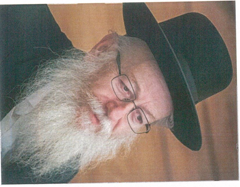
כחנן ישראל להתייחס לדרביים כמלון, פלוג וליצמן. בנק ישראל סירב להגיב לדרביים

רווחים היעלה ב"20%". ליון הוסיף כי הנגזרה "עוסקת בהשוואות פשטניות מאקרו-בינלאומיות, שאינן מתאימות למציאות הישראלית. בנק ישראל עדיין שנוי בתפיסה השגויה שהעלאת נטל המס מגדילה את הכנסות המדינה, בעוד שהוכח עד היום כי דווקא הפחתת נטל המס על המגזר העסקי מעוררת צמיחה. היקף הכנסות המדינה מושפע יותר מההכנסה הפעילית הכלכלית". בתגובה לפניית "מעריב-השבוע" סירבו בכנן ישראל להתייחס לדרביים.