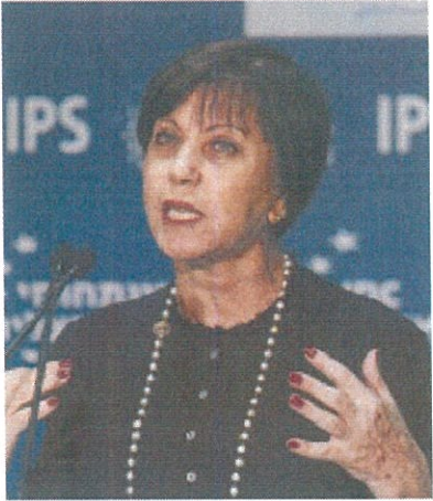
יו"ר מרצ, זהבה גלאון צילום: אוליבייה פיסוסי