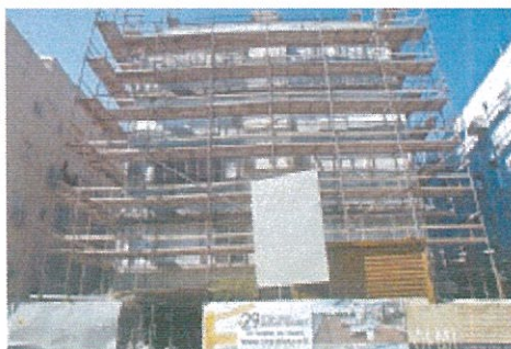
פרויקט תמ"א 38 בצפון תל אביב

עוד נטען בעבר כי הוועדה המקומית התייחסה בהנחיות לגור שאינם כלולים בחוק. לפי לשון החוק, ההנחיות מתייחסות "לחזונו ולמראהו החיצוני של הבניין, למפלסי הכניסה לבניין, להיבור שתלבות הבניין בסביבתו, להיבור לתשתיות ולעניינים נוספים כפי שקבע שר האוצר". לכן טוענים היוזמים כי כל עוד השר אינו מייחב את רשימת הנושאים שאליהם מתייחסות ההנחיות, הוועדה המי קומית צריכה להיצמד לרשימה