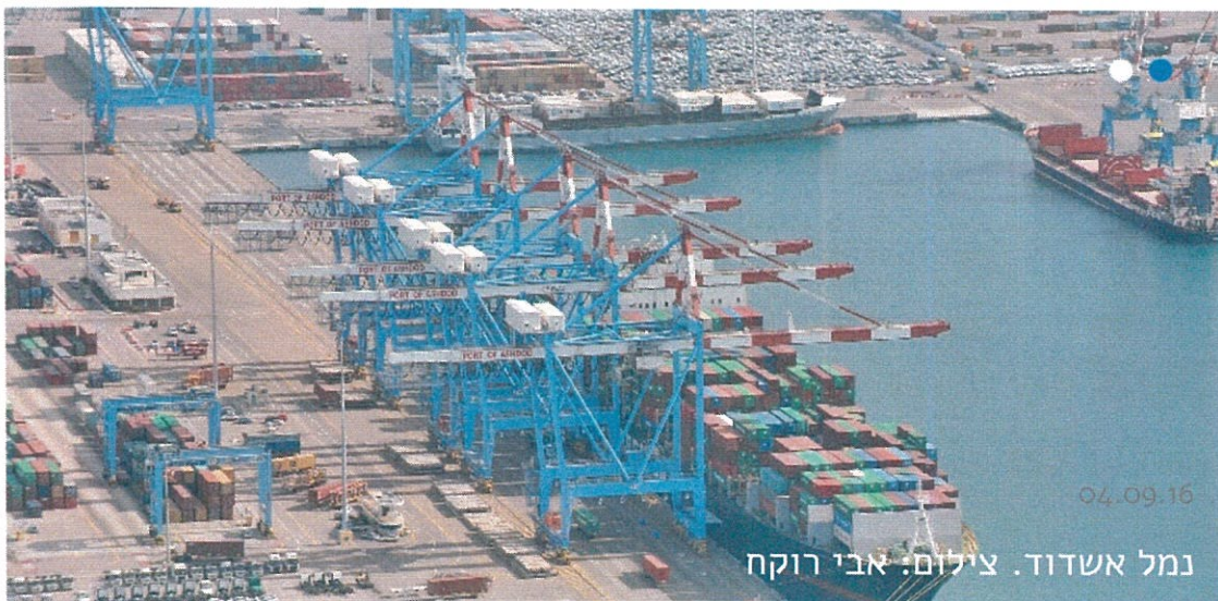
נמל אשדוד.