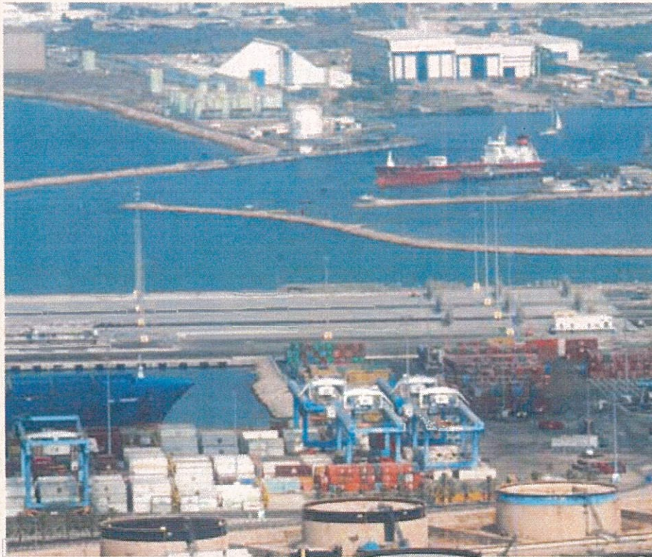
מארבעה ימים לשבעה ימים. נמל חיפה

פריקת מכולות ושינוע יבשתי. "סמיכות ורצף חגי תשרי תשע"ו עלולים ליצור הצטברות גדולה מהרגיל של מכולות מטענים ושהייה ארוכה יותר של מכולות הנפרקות מהאניות ואי יכולת להחרוך ולהובילן מהנמל כבימי שגרה".