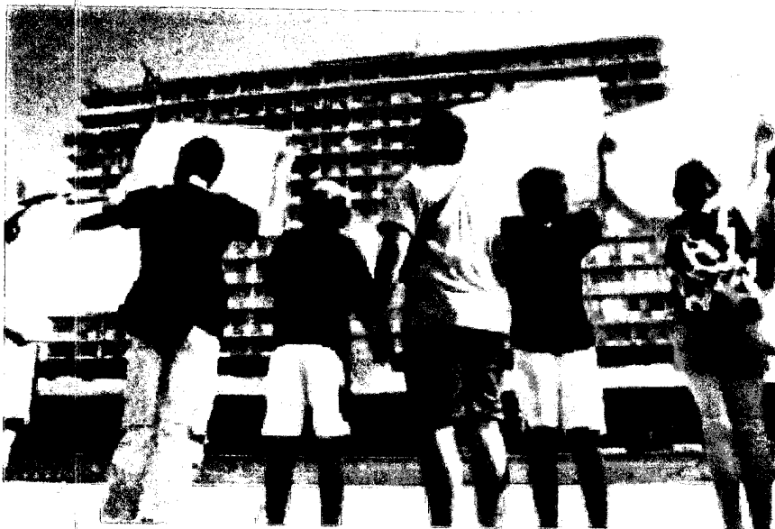
הפגנה מול עיריית תל אביב. הנוסחה של עדיכון הארנונה איבדה קשר למציאות שילוח נדב

« מה הקשר בין שברם החודשי של מנהל המחלקת הבריאותית לבלי רם בבית החולים מורוקה (106,018 שקל ברוטו, על פי דרישת הממונה על השכר ויחסי העובדי זה במשרד האוצר), מנביל רמאל (105,353 שקל), מנהל היחידת רדיולוגיה במכון של שירותי בריאות כללית (100,462 שקל), ואפילו למנהל היחידת מידע וסטטיסטיקה בבנק ישראל (66,106 שקל) ולפיט בתני שיית האווירית (80,531 שקל) – לבין גרי ביה הארנונה שאתם משלמים? בשתי מילים: שיעור העדיכון.