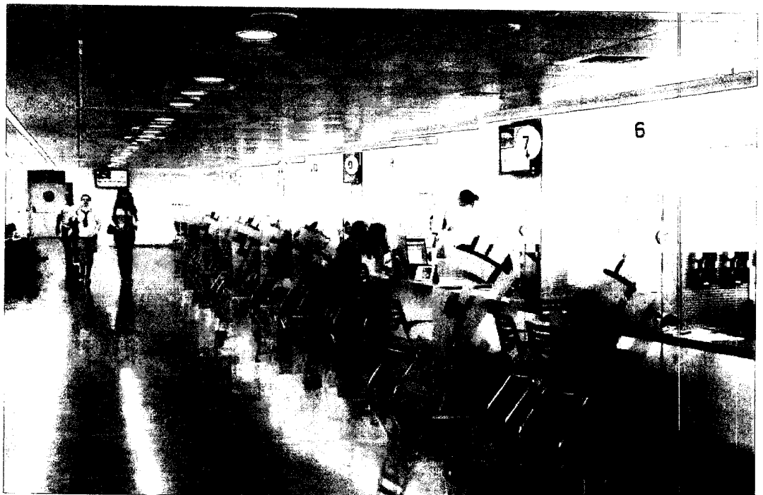
צלום אל יצוא