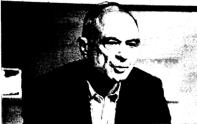
לין. "השכר של רופא בהדסה, מתורגם לארנונה של כל הפדינה"

באחרונה הודיעה עיריית תל אביב-יפו על ייקור מס הארנונה. נוסף להעלאה ב-3.66% בהתאם למדר, מבקשת העירייה אישור חריג להעלאה נוספת בשיעור 1.3%. נשיא איגוד לשכות המסחר, עו"ד אוריאל לין, זועם על המהלך ומגדיר: "תוצפה".