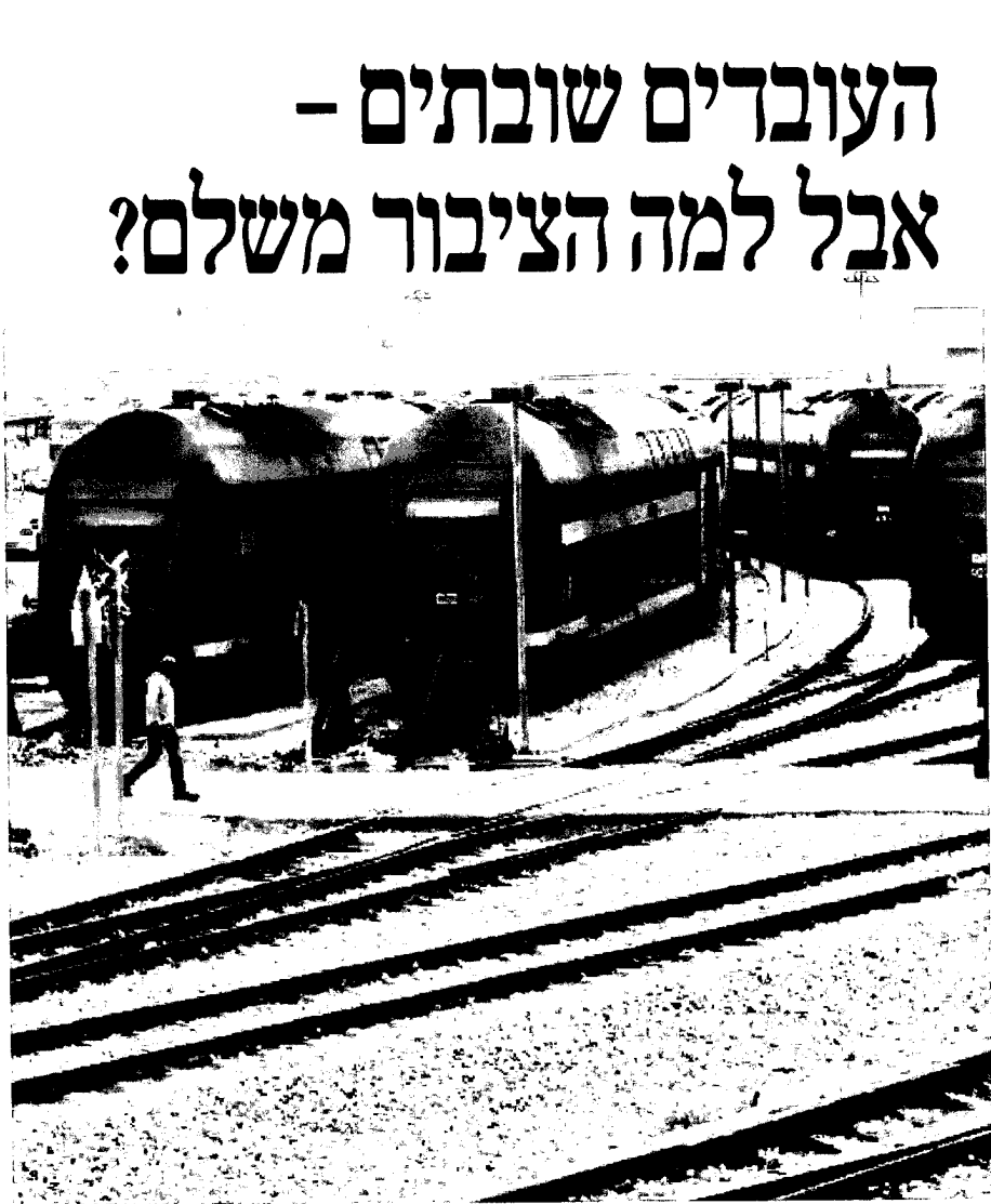
שביטה ברכבת ישראל. לא לאפשר לוועדים לתמוך מאחריות לשביטה לא חוקית ולחייבם לשאת בתוצאות הכבדות"

לפני שנה תבע תושב תל אביב מרכבת ישראל פיזייתם בסך 1,750 שקל בגין ארבעה מקרים של שביטה, שמונה מקרים של שיבושים ושני מקרי איוורורים, בעת שהיה בדרכו לעבודה או בחזרה ממנה. השופטת איילה גזית מבית משפט השלום בתל אביב רחמה את התביעה לגבי ימי השביטה שנקטו עובדי הרכבת, "הואיל ובמסגרת היחסים החוזיים בין הנתבעת לנוסעיה השביטה לא תיחשב כהפרת חוזה מצד הנתבעת", ואולם משהוכיחה התובעת כי העיצומים שנקטו עובדי הרכבת כיתר הימים נעשו תוך הפרת צו של בית משפט שהורה להם לחזור לעבודה - קיבלה השופטת את תביעתו, וחייבה את הרכבת לפצותו בכרטיס שווה ערך. במקרה זה ידע בית המשפט