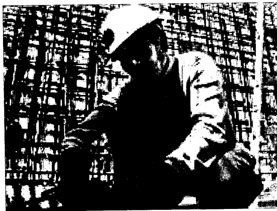
אתר בנייה / צלם: איל יצהר אתר בנייה / צלם: איל יצהר

משרד ראש הממשלה מקדם מודל חדש להבאת עובדים זרים לענף הבנייה, כך עלה מדיון שנערך היום (ב') בנושא מצוקת העובדים הזרים בענף בוועדת הפנים והגנת הסביבה של הכנסת.