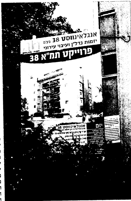
פרויקט תמ"א 38 בהרצליה. פחות כללים נוקשים

בומן שמרובר בהקלה משמעותית שעשויה לתרום לחיזוק מספר גדול יותר של מבנים, יש לציין שהיא איננה רטרואקטיבית, וכל פרויקט שכבר קיבל היתר בנייה או יקבל עד התאריך הקובע באוגוסט עדיין יצטרך לעמוד בתקנות הישנות. על כך אומר תמס: "מי שירצה לבנות על פי התקנות החדשות וכבר הוציא היתר יצטרך להוציא היתר מחדש".