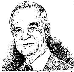
לין. "סיכול מהלך חיוני"

בהתאם להערכות המוקדמות, פנה היום (א') איגוד לשכות המסחר לבית הדין הארצי לעבודה בדרישה למנוע את השביחה המתוכננת בנמלי חיפה ואשדוד עוד לפני שהיא פורצת. באיגוד, בראשות אוריאל לין, מבקשים להוציא צווי מניעה לעובדי הנמלים בטענה כי מדובר בעילה בלתי חוקית לשביחה, שנועדה לסכל החלטת ממשלה הפועלת בתחום סמכותה. הכוונה היא להחליטה