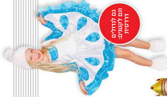
גם לגודלים וגם לקטנים: דרדסית

על פי נתוני גוגל המילה "תפישות" היא המבוקשת ביותר לקראת המ"ן. במקום השלישי "משלוח מנות"