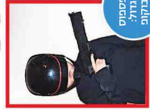
הפססום הגדול: הבוקוב