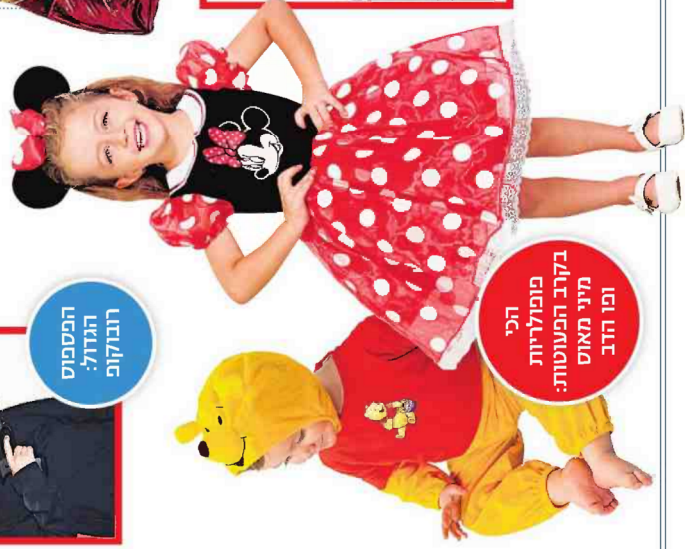
הכי פופולריות בקרב הפעוטות: מיני מאוס ומו הדב