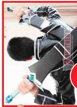
הכי יקר: קריטו

כמו לקוחות ישראלים, אך היא טרם נקתה. יש עוד כמה ימים עד פורים ואולי תסיקו. ואם אתם לא מודעים עם קריטו אפשר לקנות תפישות של ספירדמן ב-675 דולר (כ-2,400 שקלים).