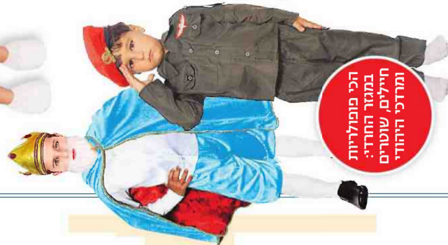
הכי פופולריות במגזר החרדי: חיילים, שוטרים ומרדכי היהודי

על פי נתוני גוגל המילה "תפישות" היא המבוקשת ביותר לקראת המ"ן. במקום השלישי "משלוח מנות"