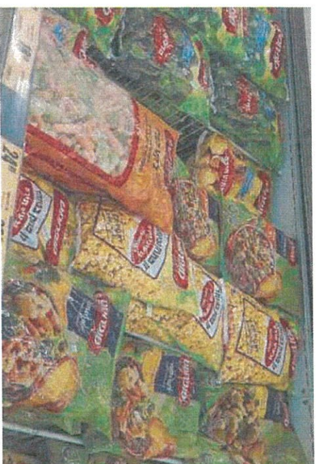
ירקות קפואים ברשת מזון

קוח קפואים ושמן זית – אמרו הנציגים: "אנחנו מצדדים בהפחית מכסים בצורה מבוקרת כרי- קוח הקפואים תוך ליווי ההורדה כבייקת השפעה על המשק. התעי רכה שלנו היא שמחירי הורקות הקפואים יורדו משמעותית". לגבי הכוונה לפתוח מכסות פטרות ממכס ליבוא שמן זית, אמר רד הנציגים כי הם מצדדים בכייטול מחלת של המכס: "ממילא מגדלים ישיאלים של עצי זית לא מספקים את כל הביקוש המקומי". מגדלי הזיתים מתכננים לעי- לוח היום לירושלים עם עצי זית כרותים צמועים בארזים, כחלק ממאבקם למניעת חודרת המכסים לדרביהם, ההורדה תפגע קשות בענף בישראל.