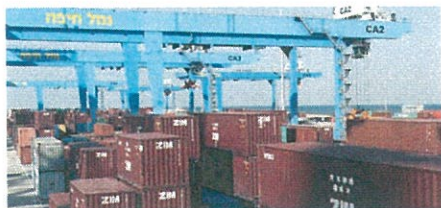
מקל בגלגלים: האם תנועת החרם על ישראל פוגעת ביצוא?