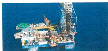
SHELL תרכוש את BG - וחוזר יצוא הגז של "לווייתן" בסכנה