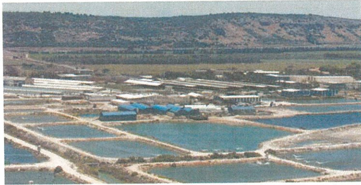
בריכות דגים במעון מיאל. ענף הדגה – אחד הענפים הראשונים שיעבור לתמיכות ישירות

אחד הענפים הראשונים שייחשף כבר בקרוב למעבר מתמיכות עקיפות לישירות הוא ענף הדגה. בשיחות שנערכו אתמול במשרד החקלאות התגבשה הבנה עקרונית, שגם המוצרים יורדו מ-100% ל-50% בשיבוי, למחירם. בהמשך, לאחר בחי