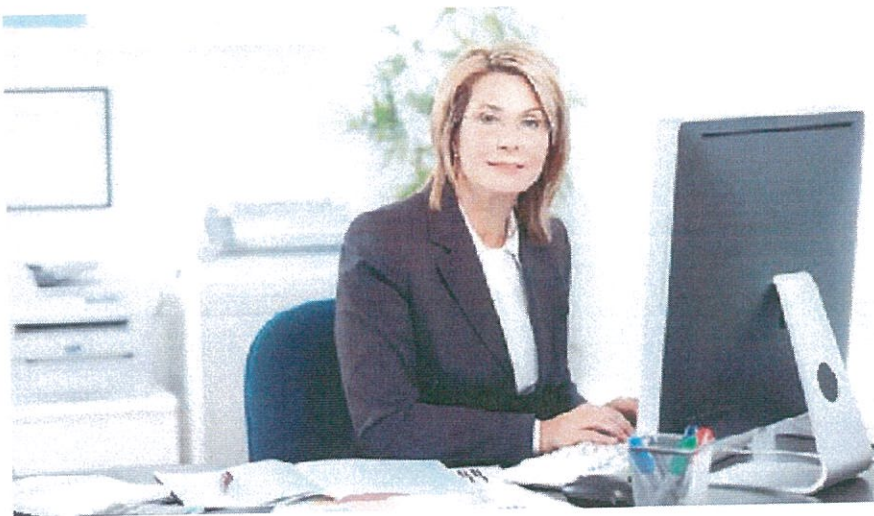
ביטול פרישת חובה, הסכירה באותו כנס.