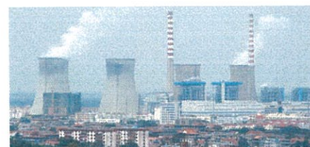
מתקשה להעמיד ביטחונות ליצוא? יש לנו פתרון עבורך