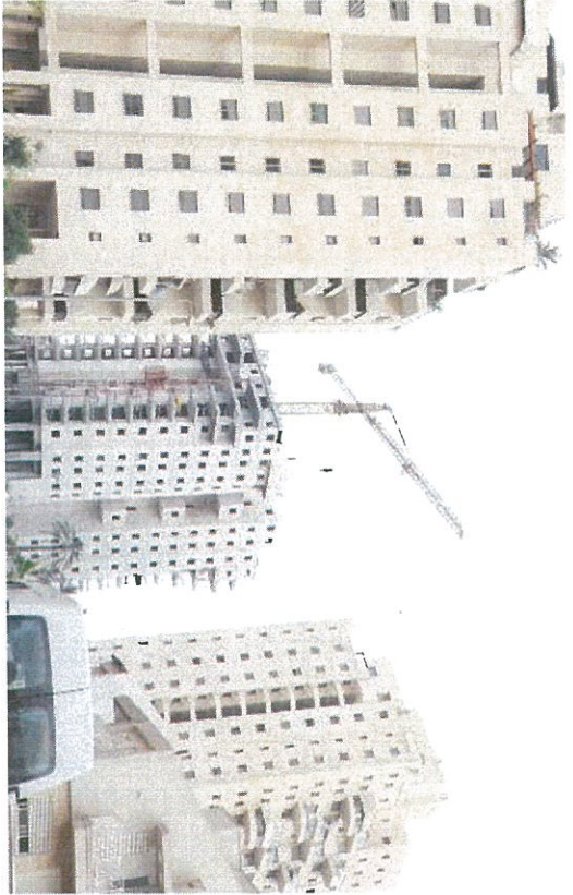
בניית בנייני מגורים. שר האוצר מבקש להאיץ את קצב הבנייה בארץ