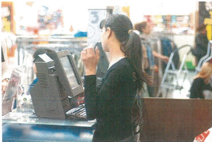
הרשתות דורשות שהמדינה תממן קורסים להכשרת מוכרנים ומנהלי סניפים

גורם המקורב לפעילות ועדת הפריזן של האוצר: "הכשרות ותמריצים למוכרנים ישפרו את תפקיד המוכרן ואולי יעשו טוב לסקטור מסוים, אבל בפירוש שלא יעלו את הפריזן"