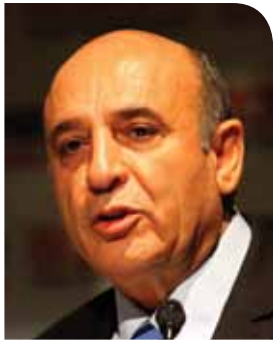
ח"כ שאול מופז המשנה לראש הממשלה