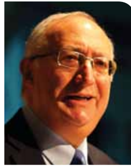
פרופ' מנואל טרכטנברג יו"ר הוועדה לשינוי חברתי כלכלי

"קדימה תעשה ככול האפשר לתמוך בחוק זכויות המעסיקים שיזמה לשכת המסחר, לאחר שתלמד אותו"