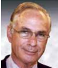
אביהו בנינון, סגן נשיא