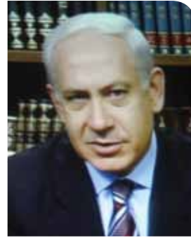
ח"כ בנימין נתניהו ראש הממשלה

"עלינו לשמור על מדיניות כלכלית יציבה, המעודדת השקעות בישראל. אם נאבד את ההשקעות בישראל נאבד את חוסנו הכלכלי"