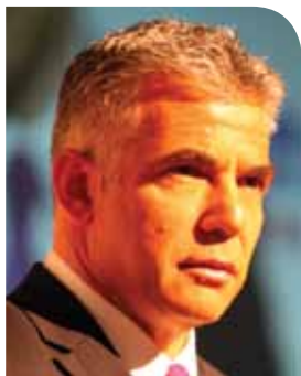
יאיר לפיד יו"ר מפלגת יש עתיד