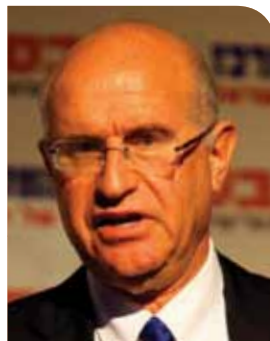
ח"כ פרופ' אבישי ברורמן מפלגת העבודה

"בניגוד למצב הרוח שיש כיום בישראל, אני לא מאמין שאנחנו צריכים לבחור בין כלכלה עילה ותחרותית לבין צדק חברתי. אנחנו צריכים לשלב בין שניהם"