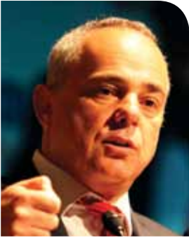
ח"כ ד"ר יובל שטייניץ שר האוצר