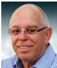
עמי לפידות, סגן נשיא